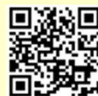
「米づくりナビ」 アクセスはこちら

○「やまがた米づくりナビ」の2026版「穂肥診断マップ」が6月30日にアップされました。自分の圃場をご覧になって、穂肥作業の参考にしてください。