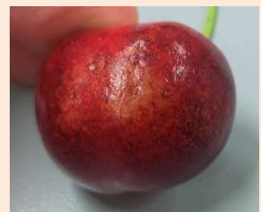
日焼け果（やまがた紅王）

◆やまがたアグリネットに会員登録（無料）いただくと、「 高温少雨対策マニュアル（R6年3月作成） 」「 さくらんぼ高温対策マニュアル（R7年3月作成） 」の閲覧が可能です。ぜひご覧ください。